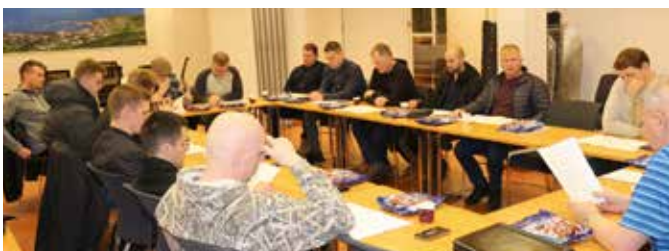
Fundir sjómanna innan Framsýnar eru líflegustu fundir sem haldnir eru á vegum félagsins. Það verður seint sagt um sjómenn að þeir séu skoðanalausir.