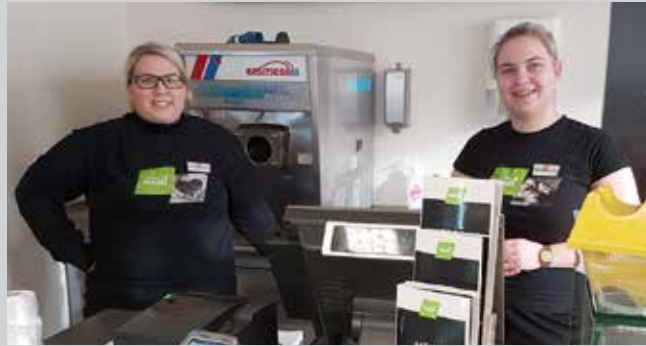
Verslunar- og skrifstofufólk innan Framsýnar á rétt á góðum námsstyrkjum eða allt að kr. 390.000,-.

Veittir fyrirtækjastyrkir hækkuðu einnig um síðustu áramót í samræmi við styrki til einstaklinga. Frekari upplýsingar má nálgast á Skrifstofu stéttarfélaganna á Húsavík eða inn á starfsmennt.is