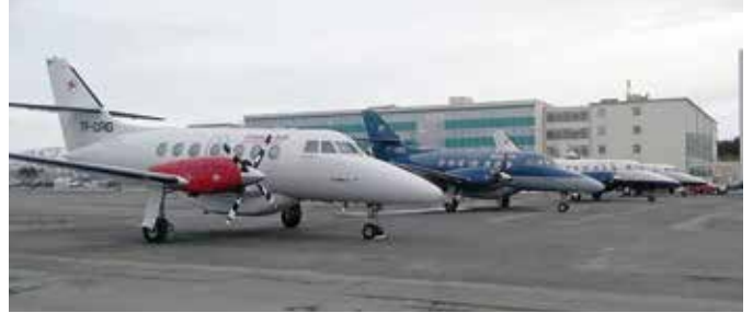
Góð kjarabót fyrir félagsmenn. Stéttarfélagin hafa ákveðið að bjóða félagsmönnum upp á óbreytt verð á flugmiðum árið 2018.

Stéttarfélagin, Framsýn, Þingið, Verkalýðsfélag Þórshafnar og Starfsmannafélag Húsavíkur hafa ákveðið að bjóða félagsmönnum upp á sama góða verðið á flugmiðum á vegum félaganna milli Húsavíkur og Reykjavíkur með flugfélaginu Erni á árinu 2018. Verðið verður áfram kr. 8.900,- per flugferð. Á síðasta ári seldu félagin um 4400 flugmiða til félagsmanna en í heildina fóru rúmlega 18 þúsund farþegar um flugvöllinn. Ljóst er að þetta er ein besta kjarabót sem félagin geta boðið upp á enda hafa fjölmargir félagsmenn lýst yfir mikilli ánægju sinni með framtak félaganna að bjóða þeim upp á ódýrt flug milli Húsavíkur og Reykjavíkur. „Þetta eru aukin lífsgæði eins og einn eldri félagsmaður orðaði það „Nú get ég farið suður og heimsótt börn og barnabörn án þess að það kosti augun úr.“