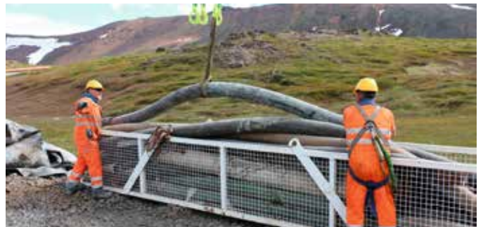
Stéttarfélagin bjóða félagsmönnum upp á góða styrki til starfsmenntunar. Frekari upplýsingar eru í boði á Skrifstofu stéttarfélaganna á Húsavík.

Um er að ræða breytingar sem tóku gildi 1. janúar 2018 og þá gagnvart því námi sem hefst frá og með þeim tíma. Aðrar reglur verða óbreyttar og gilda samhliða fyrrgreindum breytingum.