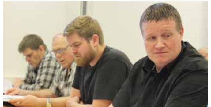
Um 122 milljónir voru greiddar í atvinnuleysisbætur til félagsmanna Framsýnar á síðasta ári. Allt bendir til þess að atvinnuástandið lagist verulega á árinu 2015 enda miklar framkvæmdir fyrirhugaðar á svæðinu.

Á aðalfundi Framsýnar kom fram ákveðin bjartsýni varðandi atvinnuálin þar sem framkvæmdir eru hafnar á Peistareykjum auk þess sem framkvæmdir á Bakka fara væntanlega af stað á næstu vikum.