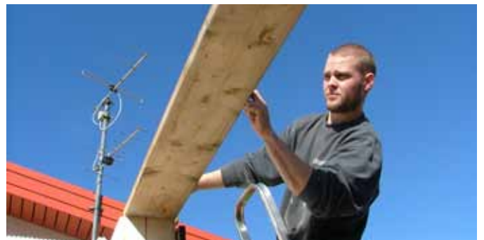
Iðnaðarmenn innan Þingiðnar eru bednir um að fylgjast vel með gangi kjaraviðræðna Samiðnar og Samtaka atvinnulífsins. Hægt verður að nálast upplýsingar inn á heimasíðu stéttarfélaganna www.framsyn.is um leið og eitthvað gerist.

Þegar Fréttabréf stéttarfélaganna fór í prentun var ekki búið að undirrita nýjan kjarasamning fyrir félagsmenn. Góður gangur hefur verið í viðræðunum og því líklegt að skrifað verði undir kjarasamning jafnvel síðar í þessari viku. Frekari upplýsingar verður hægt að nálgast inn á heimasíðu stéttarfélaganna um leið og einhverjar fréttir berast af viðræðum Samiðnar og Samtaka atvinnulífsins.