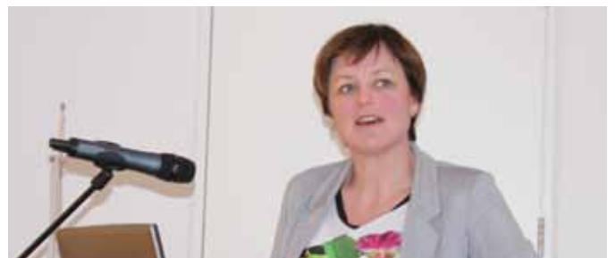
Fyrir liggur að Framsýn er afar vel rekið stéttarfélag sem skilar sér í öflugu starfi, góðri þjónustu og háum styrkjum til félagsmanna í formi fræðslu- og styrkja úr sjúkrasjóði félagsins. Tekjuafgangur á síðasta ári var um 66 milljónir.

Á Skrifstofu stéttarfélaganna á Húsavík störfuðu 6 starfsmenn í 5,2 stöðugildum. Þar að auki störfuðu 4 starfsmenn í 0,5 stöðugildum hjá Framsýn við að þjónusta orlofsíbúðir í Reykjavík, Kópavogi, við orlofshús í Óxarfirði og félagsmenn á Raufarhöfn. Fram kom hjá Huld að ársreikningurinn er gerður eftir sömu reikningsskilaaðferðum og árið á undan, að öðru leyti en kemur fram í reikningsskilakafla ársreikningsins. Í sameinuðum rekstrar- og efnahagsreikningi nam hreinn tekjuafgangur félagsins kr. 65.635.375 og eigið fé í árslok nam kr. 1.517.577.356.