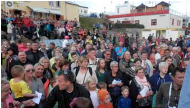
Fyrirtækjum sem greiða iðgjöld til Framsýnar fjölgar milli ára líkt og félagsmönnum.

Alls greiddu 2.378 félagsmenn til Framsýnar- stéttarfélags á árinu 2014 en greiddandi félagar voru 2.265 árið 2013. Greiddandi félagsmönnum fjölgaði því milli ára um 113 eða um 5%. Samkvæmt samþykkt stofnfundar félagsins frá 1. maí 2008 er ekki lengur miðað við sérstakt lágmarksgjald svo menn teljist fullgildir félagsmenn heldur teljast þeir félagsmenn sem greiða til félagsins á hverjum tíma og ganga formlega í félagið. Um síðustu áramót voru gjaldfrjálsir félagsmenn samtals 243, það eru aldraðir og öryrkjar sem ekki eru á vinnumarkaði. Þá má geta þess að 401 launagreiðendur greiddu til Framsýnar á síðasta ári og fjölgaði þeim um 55 á milli ára. Árið á undan greiddu 346 launagreiðendur til félagsins.