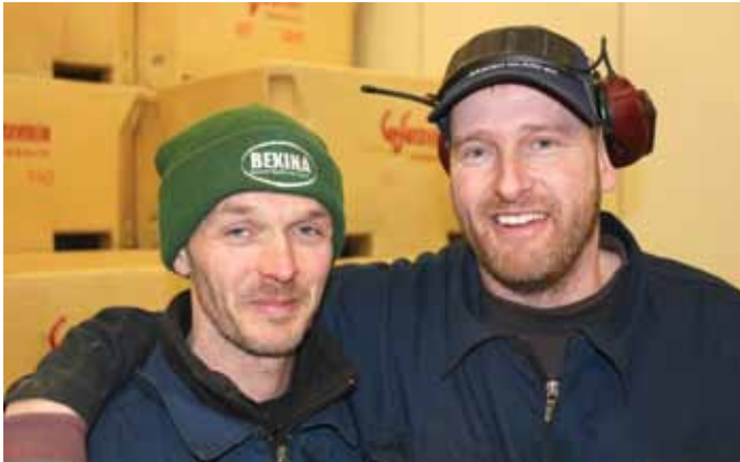
GPG-Fiskverkun greiddi mest allra launagreiðenda í iðgjöld til Framsýnar eða samtals kr. 9,9 milljónir á árinu 2014.

GPG Seafood ehf. Norðurþing Norðlenska matborðið ehf. Brim hf. Ríkissjóður Íslands Þingeyjarsveit Hvammur, heimili aldraðra