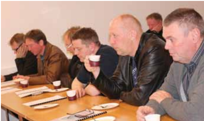
Hugsandi iðnaðarmenn á aðalfundi Þingiðnar.

Aðalfundur Þingiðnar vegna starfsársins 2014 fór fram þriðjudaginn 26. maí í fundarsal stéttarfélaganna. Fundurinn fór vel fram. Fullgildir félagsmenn í Þingiðn 31. desember 2014 voru 93 talsins. Greiðandi einstaklingar voru 85 á árinu samkvæmt ársreikningum félagsins. Karlar voru 83 og konur 2. Ákveðnar væntingar eru um að félögum komi til með að fjölga á þessu ári vegna framkvæmda á Þeistareykjum og á Bakka við Húsavík. Þá má geta þess að félagsgjöld og iðgjöld ársins námu kr. 6.417.377 sem er 12,2% hækkun frá fyrra ári. Bætur og styrkir úr sjúkrasjóði árið 2014 námu kr. 2.205.806, þar af úr sjúkrasjóði kr. 1.058.333. Á árinu 2014 fengu samtals 35 félagsmenn greidda sjúkradagpeninga eða aðra styrki úr sjúkrasjóði. Samkvæmt sameinuðum rekstrar- og efnahagsreikningi nam hreinn tekjuafgangur félagsins kr. 2.618.382 og eigið fé í árslok 2014 nam kr. 211.384.832 og hefur það aukist um 1,25% frá fyrra ári. Rekstur skrifstofunnar gekk vel á síðasta ári. Þátttaka Þingiðnar í rekstrarkostnaði nam kr. 2.534.496. Innheimta félagsgjalda var með svipuðu sniði og árið á undan. Almennir eru launagreiðendur samviskusamir að skila félagsgjöldum og móttframlögum á réttum tíma. Sjá má fundargerð aðalfundarins inn á heimasíðu stéttarfélaganna, www.framsyn.is .