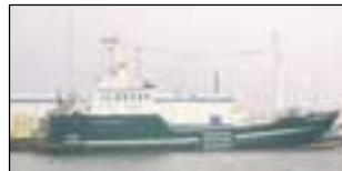
Kúfiskveiðiskipið Fossá ÞH-362.

Að sögn forsvarsmanna Íslensks Kúfisks hf. hefur kúfiskvinnslan á Þórshöfn gengið vel undanfarið eftir nokkurt hlé vegna loðnufrýstingar. Vel hefur gengið á miðunum hjá kúfiskveiðiskipinu Fossá Þh og hefur verið mogleiki.