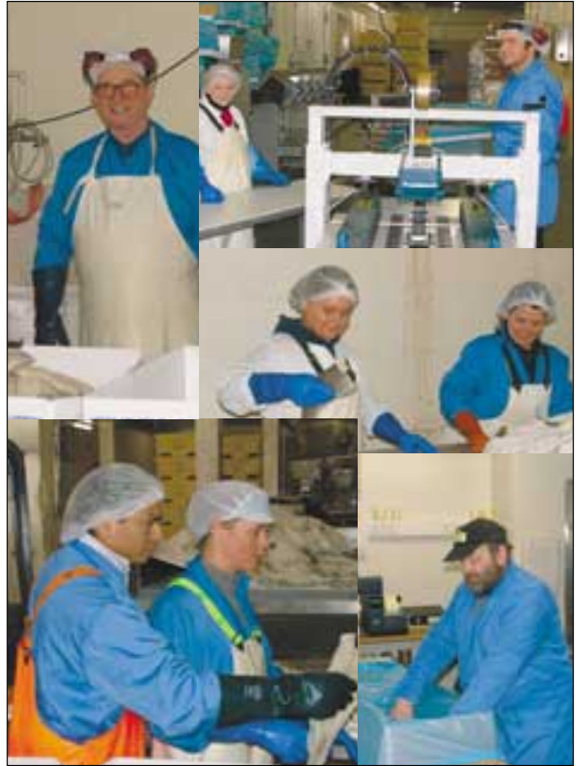
Allt bentir til þess að Verkalýðsfélag Húsavíkur og Verkalýðsfélag Rauфарbafnar sameinist í vor. Formaður Verkalýðsfélags Húsavíkur var á ferð um Rauфарböfn fyrir nokkrum dögum og tók þá þessar myndir í fiskvinnslu GPG sem rekur öfluga fiskvinnslu á Rauфарböfn. Það var létt yfir starfsmönnum og mikið að gera. Myndirnar tala sínu máli.