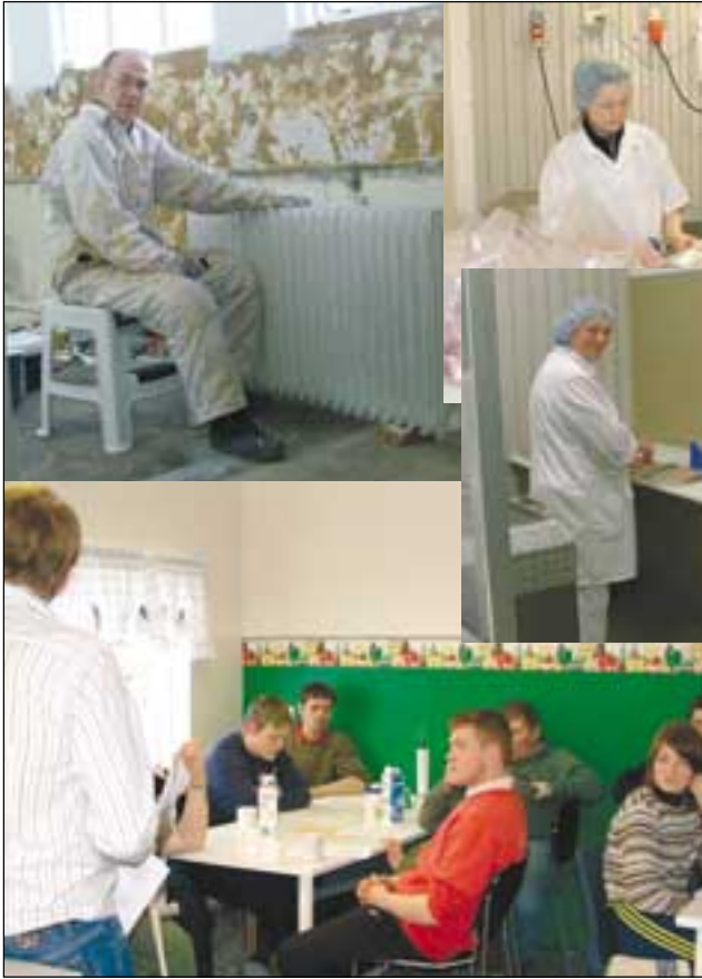
Það sem af þessu ári þafa starfsmenn og forystumenn stéttarfélaganna baldi fjölmarga fundi, bæði almenna og eins vinnustaðafundi um kjaramál. Þessar myndir eru teknar úr heimsóknnum þeirra á félagsvæði Verkalýðsfélags Óxarfjarðar og eru teknar í Fjallalambi og Silfurstjórnummi.