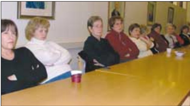
Starfsfólk Heilbrigðisstofnunar Þingeyinga hefur staðið þétt saman í þeirri kjarabaráttu sem staðið hefur yfir undanfarið við ríkið. Atkvæðagreiðslu um nýgerðan kjarasamning á að vera lokið 15. maí.

Starfsgreinasambandið gekk nýlega frá nýjum kjarasamningi við ríkið vegna starfsmanna aðildarféлага sambandsins sem starfa hjá ríkinu. Um er að ræða einn samræmdan kjarasamning í stað nokkurra samninga sem stéttarfélagin höfðu áður við ríkið. Í því sambandi má geta þess að Verkalýðsfélag Húsavíkur hafði einn samning við Heilbrigðisstofnun Þingeyinga og var síðan aðili að öðrum samningi sem var fyrir aðra starfsmenn ríkisins sem starfa á félagsvæðinu. Nýi samningurinn er með sambærilegar hækkunar og um samdist í kjarasamningi Starfsgreinasambands Íslands (SGS) og Samtaka atvinnulífsins (SA). Í lok samningstímans kemur til viðbótar 0,5% hækkun þar sem samningurinn gildir heldur lengur en samningur SGS og SA. Gildistíminn er til 31. mars 2008. Hægt er að fá samninginn á Skrifstofu stéttarfélaganna og verður því ekki farið ítarlega yfir samninginn í Fréttabréfinu. Þó er rétt að geta þess að verulegur ávinningur náðist í að jafna rétt allra ríkisstarfsmanna er varðar greiðslur í lífeyrissjóði því í lok samningstímans verður mótframlag ríkisins orðið 11,5% í stað 6% eins og nú er. Þessi krafa hefur lengi verið mikið baráttumál stéttarfélaganna innan Starfs-